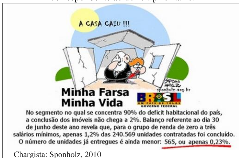
Figura 4: Charge retratando o baixo atendimento do PMCMV para a faixa de renda correspondente ao déficit prioritário.

Chargista: Sponholz, 2010