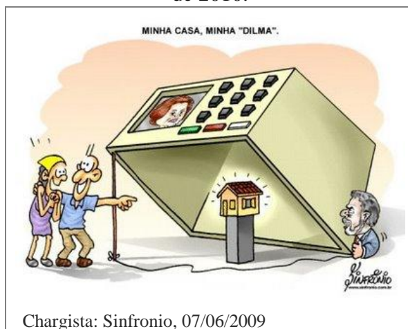
Figura 2: Charges de cunho político relacionando o PMCMV às eleições presidenciais de 2010.

O texto sugere uma disparidade entre o discurso e as ações implantadas pelo Programa. A produção de diferentes chargistas ilustra crítica semelhante e aponta o PMCMV como instrumento de marketing político nas eleições presidenciais do final de 2010, conforme ilustrado na Figura 2. A charge, intitulada " Minha Casa, Minha Dilma ", retrata o então presidente Lula e a candidata à presidência Dilma e esboça a relação entre o processo eleitoral e os possíveis ganhos acarretados pelo programa habitacional, a partir de uma urna disposta como uma espécie de arapuca de passarinhos e o deslumbramento/ felicidade da população em relação às moradias.