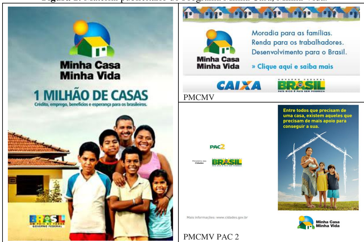
Figura 1: Material publicitário do Programa Minha Casa, Minha Vida.